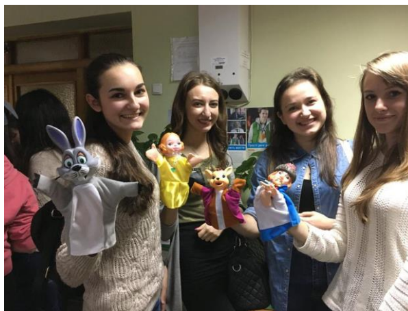
Навчальні заняття для волонтерів

ДОПОКИ ЛЮДИНА ВІДЧУВАЄ БІЛЬ – ВОНА ЖИВА. ДОПОКИ ЛЮДИНА ВІДЧУВАЄ ЧУЖИЙ БІЛЬ – ВОНА ЛЮДИНА