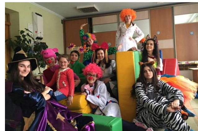
Лікарі Свято передають подарунки дітям від Святого Миколая