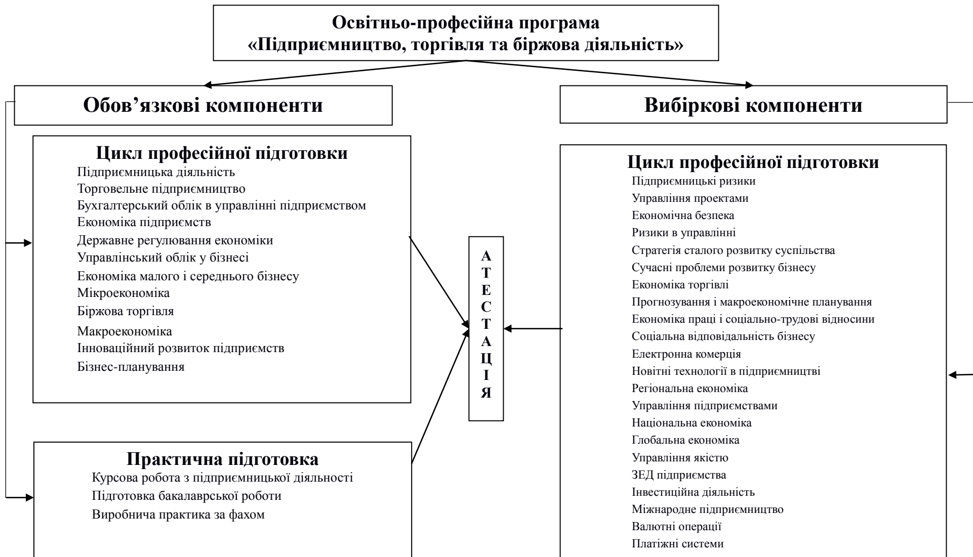
Рис. 1. Схема компонентів освітньо-професійної програми «Підприємництво, торгівля та біржова діяльність» (120 кредитів ЄКТС)