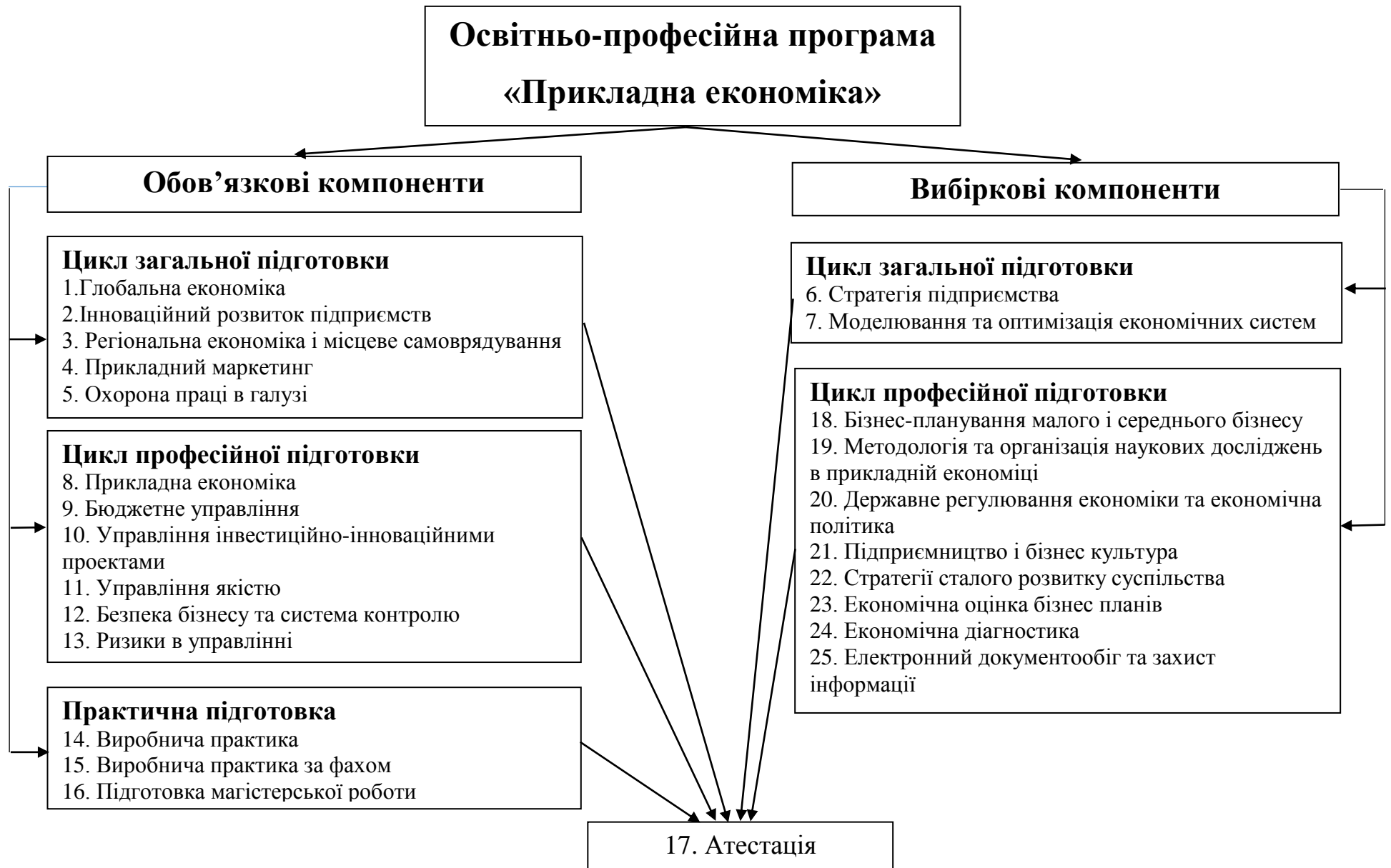
Рис. 1. Схема компонентів освітньо-професійної програми «Прикладна економіка»