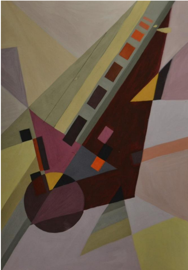
Іл. 4. Динаміка, тепла гама

Порядок проведення та критерії оцінювання вступних випробувань регулюється Положенням про організацію вступних випробувань у Прикарпатському національному університеті імені Василя Стефаника.