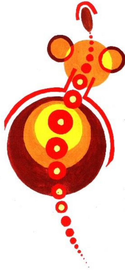
Мал.2. Динаміка, гаряча гама.