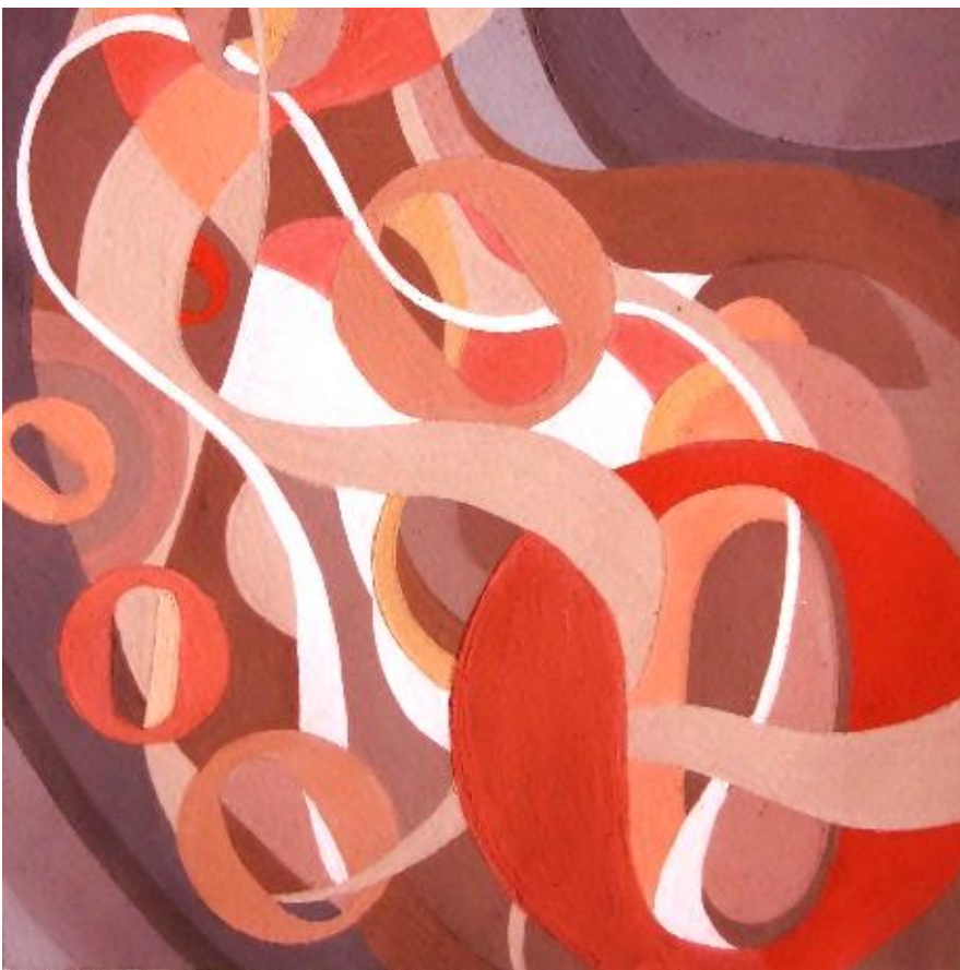
Мал.2. Динаміка, гаряча гама.