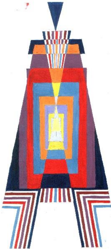
Мал.3. Симетрія, мішана гама.