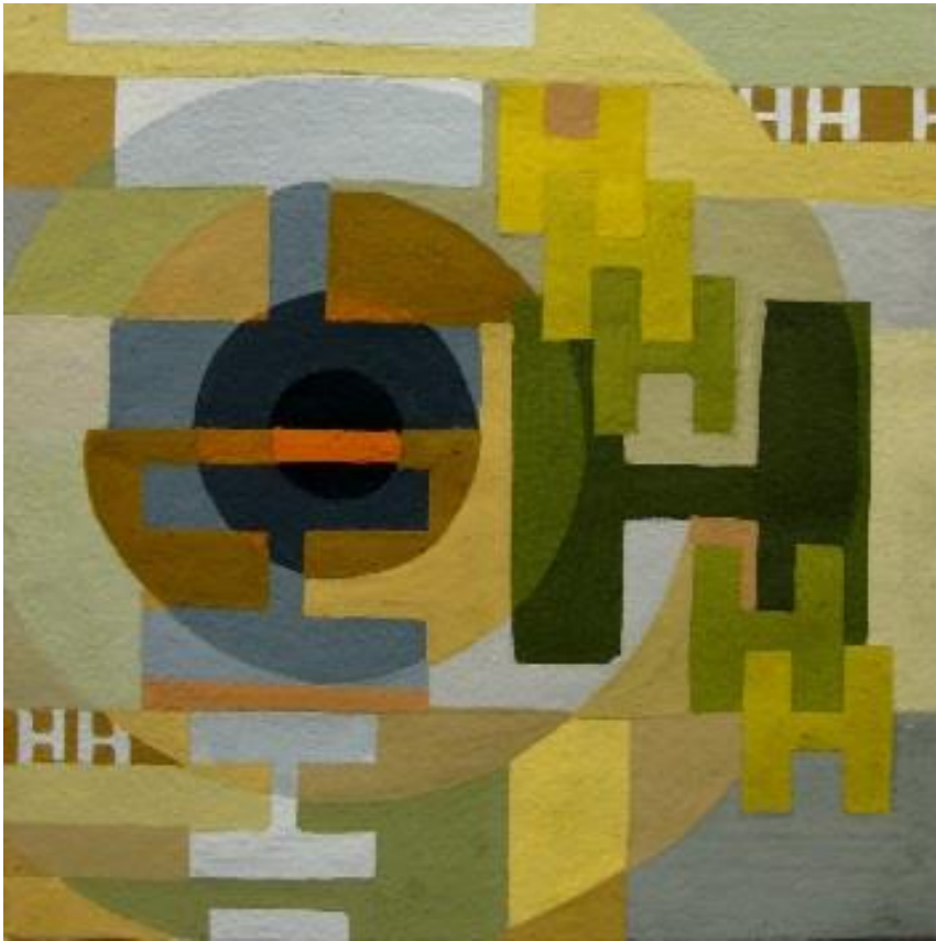
Мал.3. Асиметрія, мішана гама.