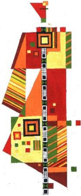
Мал.1. Статика, гаряча гама.