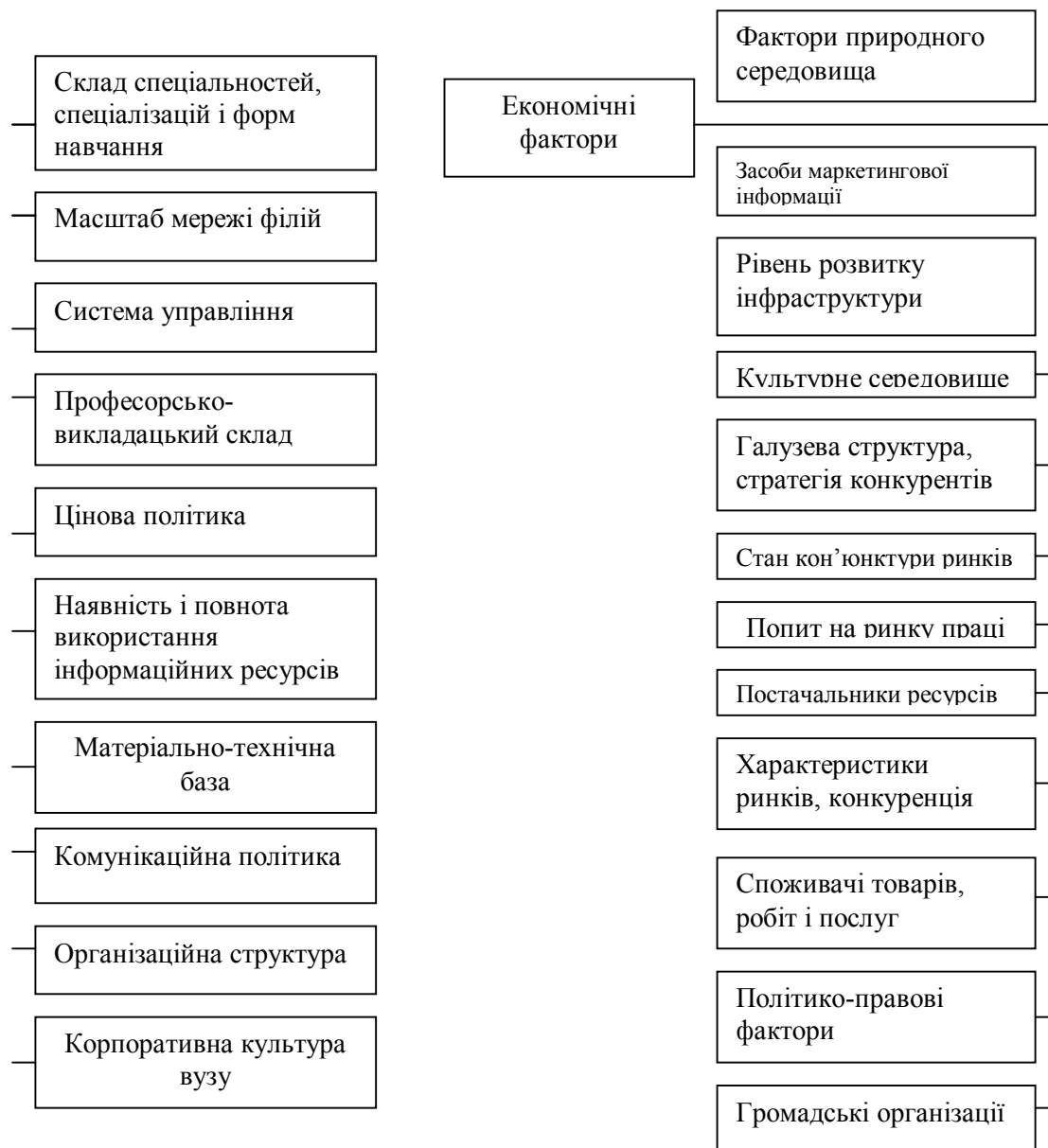
Рис. 2. Класифікація факторів, що впливають на конкурентоспроможність вищого навчального закладу