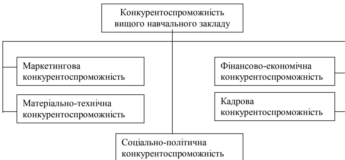
Рис. 1. Обсяг поняття “конкурентоспроможність вищого навчального закладу”

Ми пропонуємо виділяти в обсязі поняття “конкурентоспроможність вузу” п’ять частин (рис. 1).