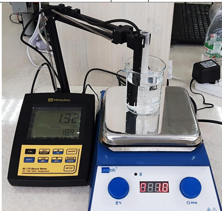
Рис. 2. Фото установки для виконання лабораторної роботи