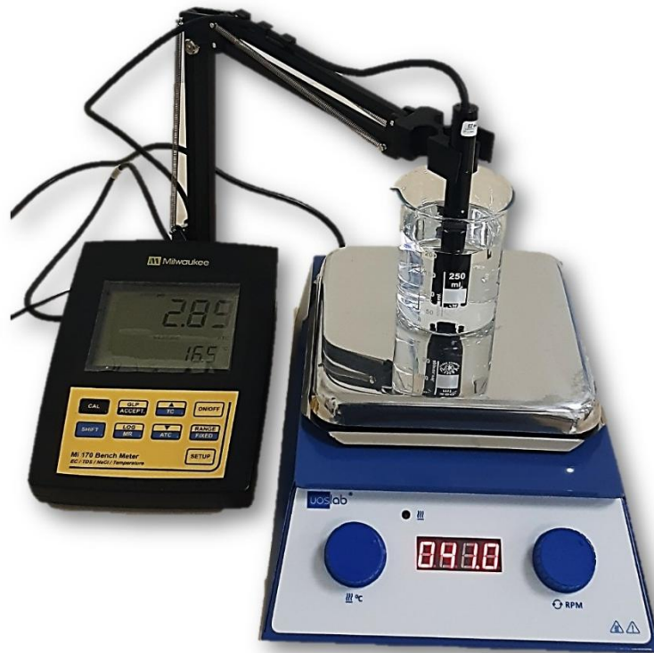
Рис. 1. Фото установки для виконання лабораторної роботи.

стабілізації значень електропровідності та записуйте отримані значення. Наважки електроліту вказує викладач.