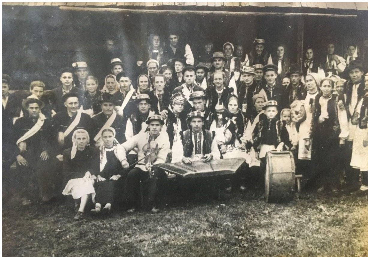
Фото 4. Гуцульське весілля в 70-х рр. ХХ ст.