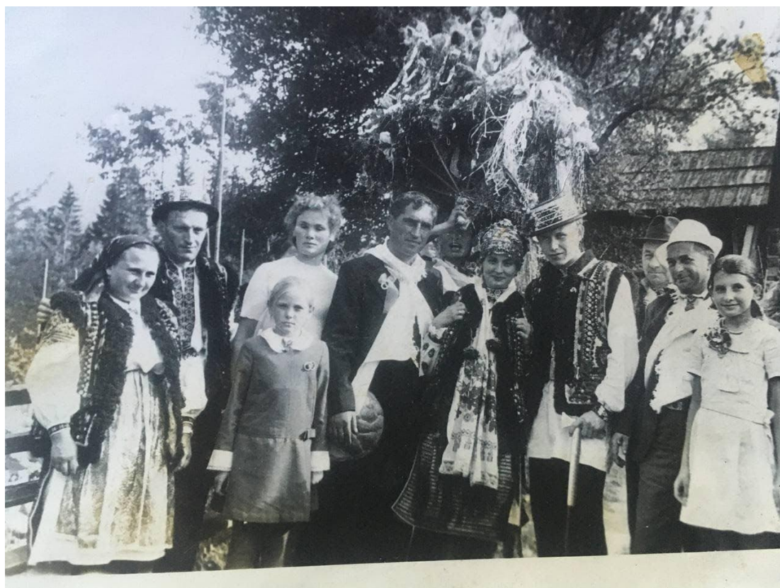
Фото 3. Гуцульське весілля в 70-х рр. ХХ ст.