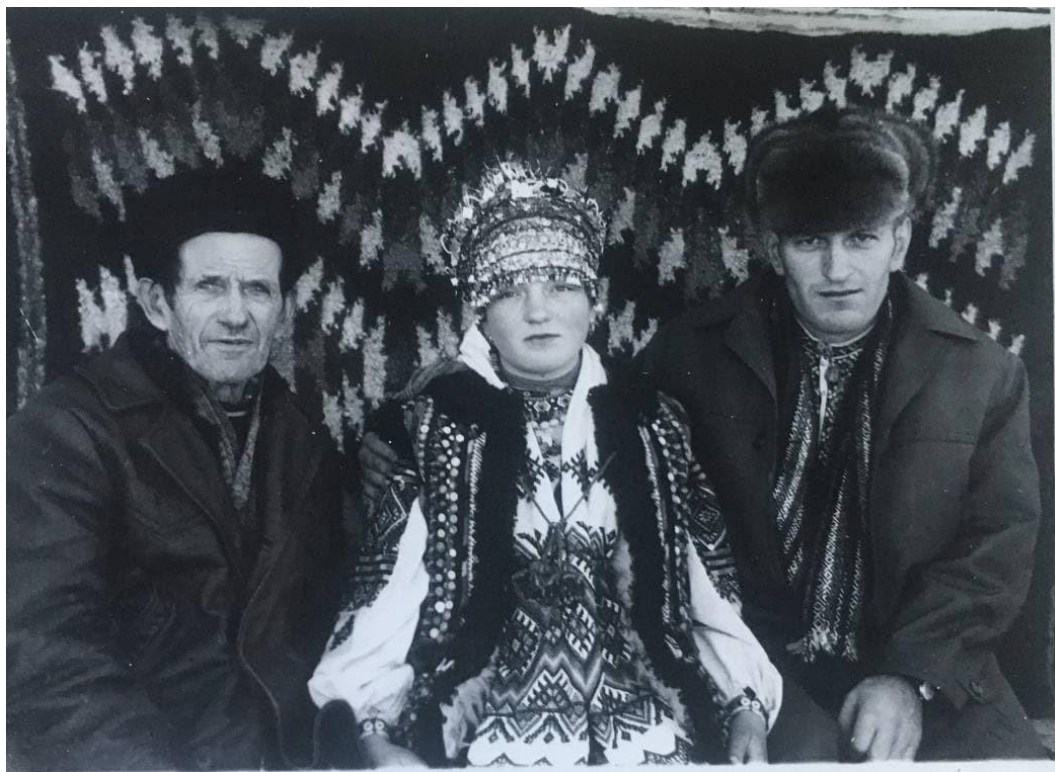
Фото 6. Гуцульське весілля 1975 р.