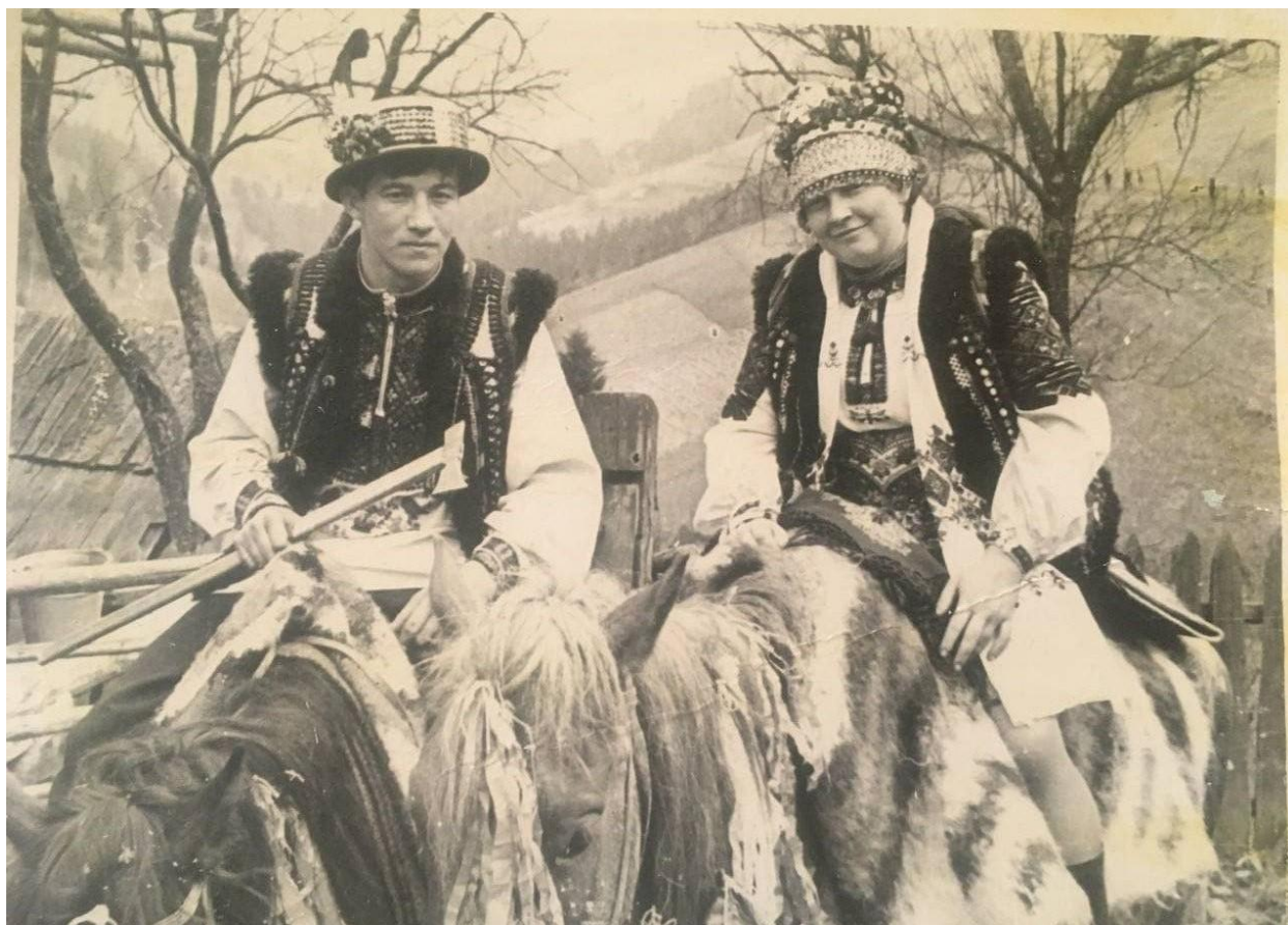
Фото 8. Гуцульські наречені на конях. Фото 60-х рр. ХХ ст.