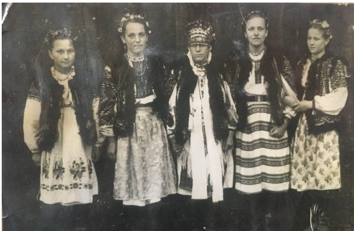
Фото 5. Наречена з дружками. Весілля в 50-х рр. ХХ ст.