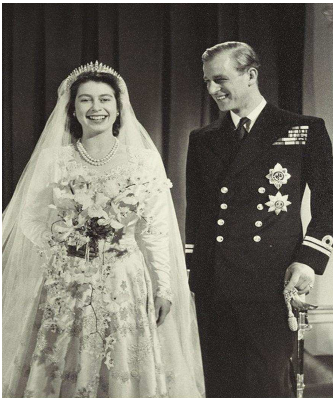
Весілля принцеси Єлизавети II і принца Філіпа, 20 листопада 1947 р.