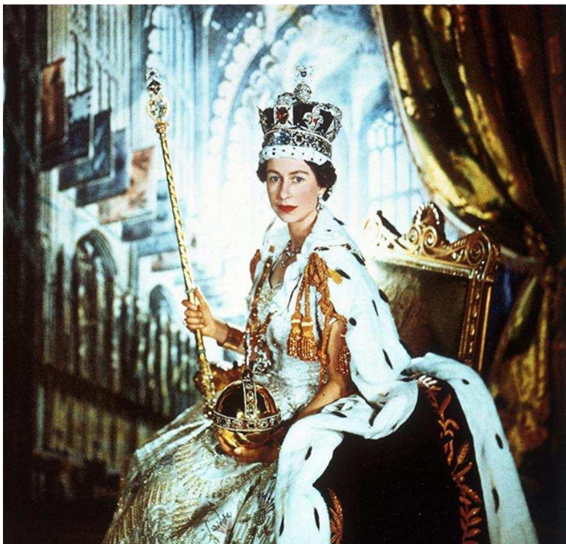
2 червня 1953 р. Коронація Єлизавети II.