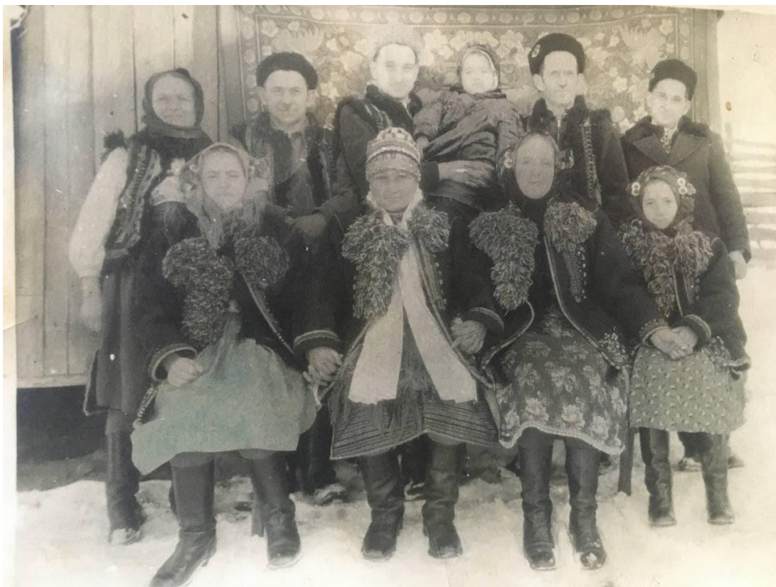
Фото 2. Весілля 29 січня 1961 р.