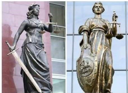
-Чому феміда біля Верховного суду РФ без пов'язки та зі щитом? - Вона не несе справедливості, вона кришує.

тому, що я... не знаю. Зрозуміло, що тут і не може бути ніякої абсолютно правильної відповіді, бо на неї завжди можна було б знайти заперечення, але ви, напевно, могли б очікувати, що я хоча б мав би якусь конкретну думку щодо цього приводу? Вона є, але полягає не в тому, що я віддаю перевагу конкретній богині, як символу, а в іншому. Дивіться, як Феміда, так і Юстиція зараз носять при собі терези, меч і пов'язку на очі.