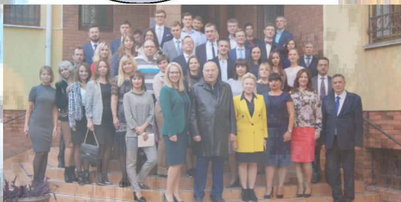
XVII Міжнародна науково-практична конференція «Правовий захист корпоративних прав за законодавством України»