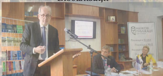
Лекції професора з Польщі