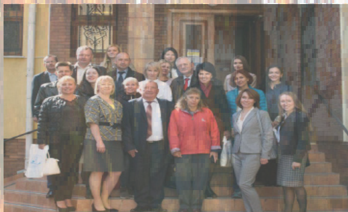
Всеукраїнська науково-практична конференція «Особливості правового регулювання екологічних, земельних, аграрних, природоресурсних відносин в умовах глобалізації»